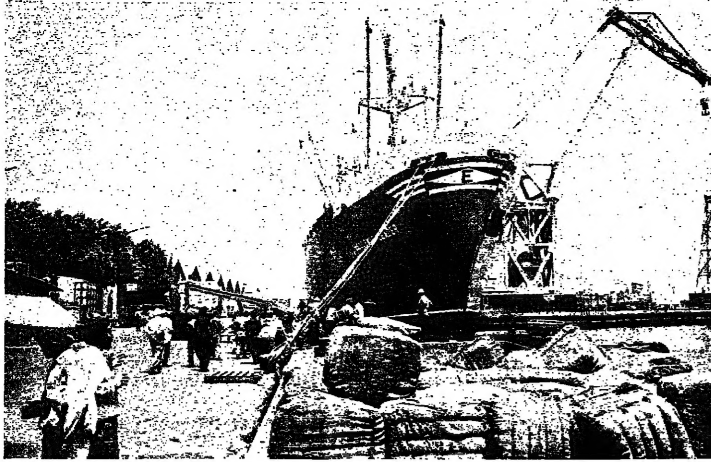
الباخرة التي علق حطام طائرة اميل البستاني في باطرها